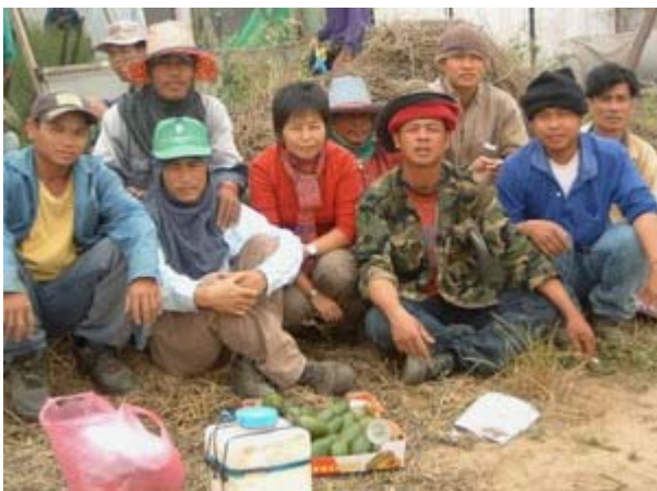
פועלים זרים מען

עובדים שעבדו 300-360 שעות בחודש קיבלו תלושי שכר המתייחסים ל-200 שעות בלבד. שיטה זו של הנפקת תלושי שכר פיקטיביים, המצהירים על 200 שעות עבודה תמורת 3,700 שקל בחודש, מאפשרת מראית עין של שמירה על שכר המינימום בענף.