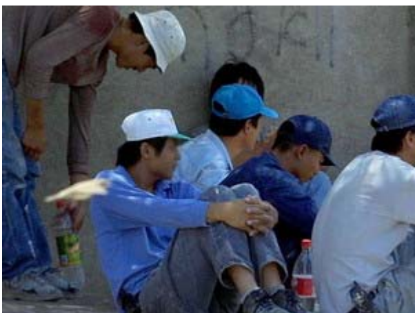
עובדים זרים

"לא ידעתי מה לעשות. שוטטתי ברחובות תל אביב וישנתי על חוף הים במשך יומיים. ביום השלישי מהגרת מסרי לנקה הציעה לעזור לי. נסעתי איתה לנתניה, שם היא התגוררה עם עובדים נוספים, והיא הפנתה אותי לעבודות ניקיון.