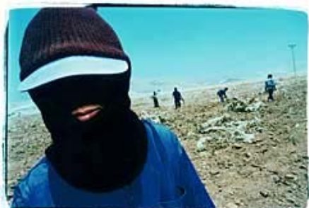
עובדים תאילנדים בערבה. ארגוני זכויות אדם סבורים כי הקבלנים מתנגדים להעסקת "ברחנים" משום שאלה כבר מכירים היטב את זכויותיהם ועומדים עליהן, בניגוד לעובדים חדשים