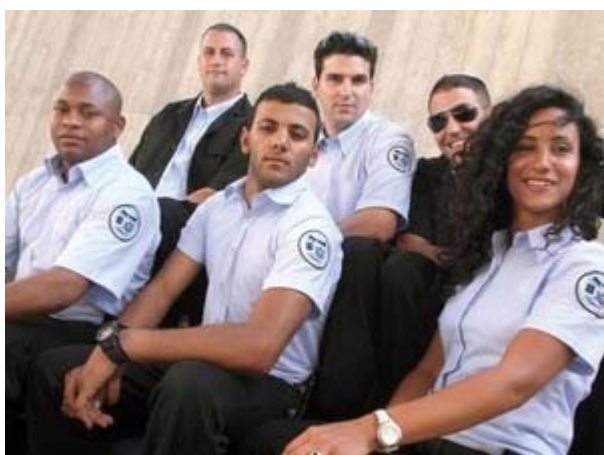
חברי היחידה האזרחית לאכיפת חוקי ההגירה